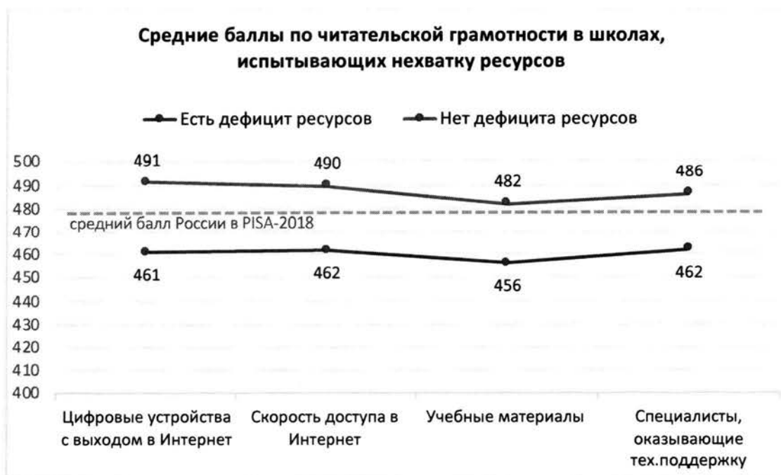
Рисунок 2. Дефициты ресурсов образовательной организации и результаты обучающихся по шкале читательской грамотности PISA относительно среднего результата РФ в PISA-2018

Дефициты ресурсов определялись на основании ответов администрации школ на вопросы анкеты и могут отражать субъективную точку зрения директора.